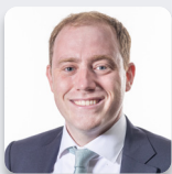
Rhys ab Owen AS Aelod Annibynnol Plaid Cymru

Roedd yr Aelod a ganlyn hefyd yn aelod o'r Pwyllgor yn ystod yr ymchwiliad hwn.