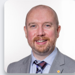
Mabon ap Gwynfor AS Plaid Cymru