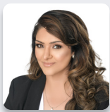
Natasha Asghar AS Ceidwadwyr Cymreig