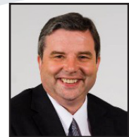
Dai Lloyd Gorllewin De Cymru