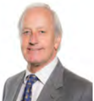
Neil Hamilton AC UKIP Cymru Canolbarth a Gorllewin Cymru