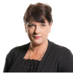
Rhianon Passmore AS Llafur Cymru