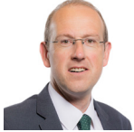
Llyr Gruffydd AS Plaid Cymru