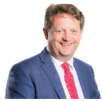
Alun Davies AS Llafur Cymru