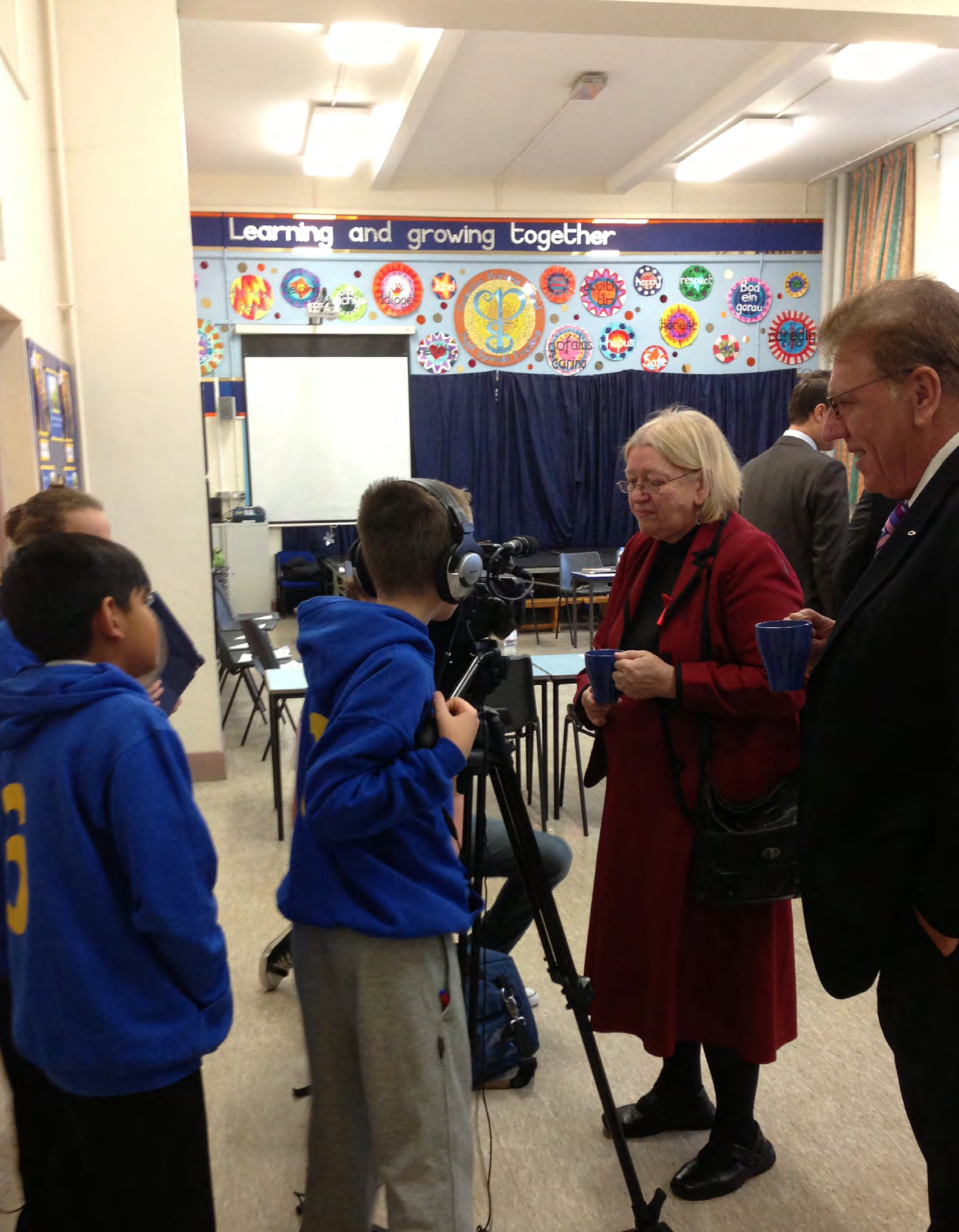
Ymchwiliad i Ganlyniadau Addysgol Plant o Gartrefi Incwm Isel Ymweliad y Pwyllgor ag Ysgol Gynradd Tregatwg, y Barri, Tachwedd 2013