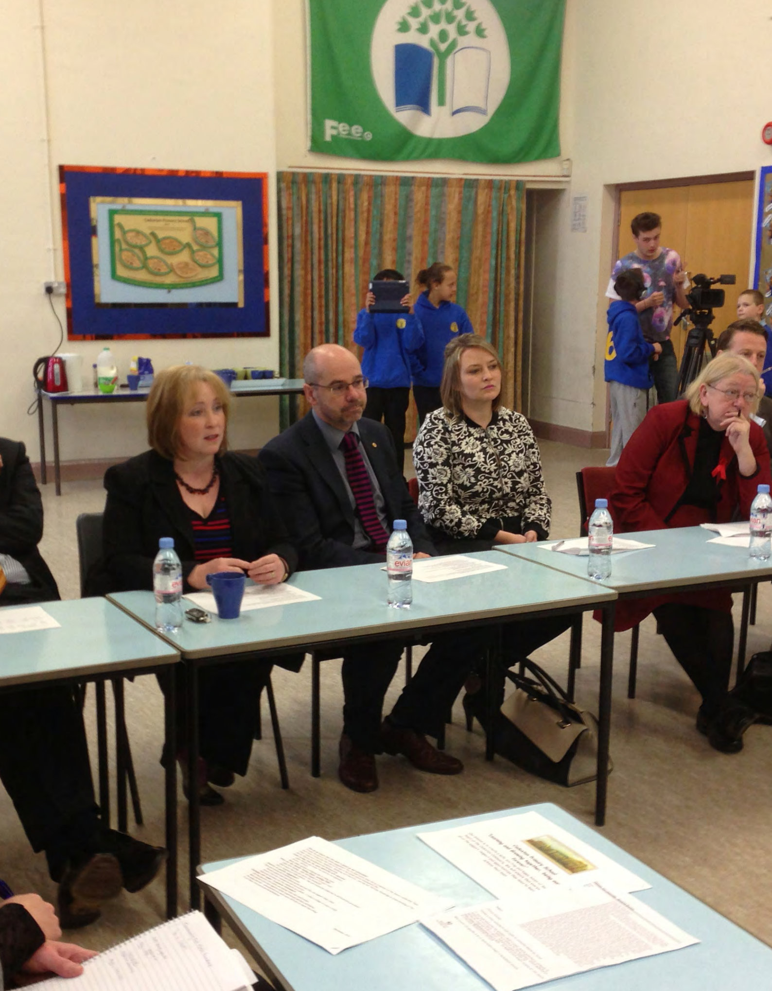
Ymchwiliad i Ganlyniadau Addysgol Plant o Gartrefi Incwm Isel Ymweliad y Pwyllgor ag Ysgol Gynradd Tregatwg, y Barri, Tachwedd 2013