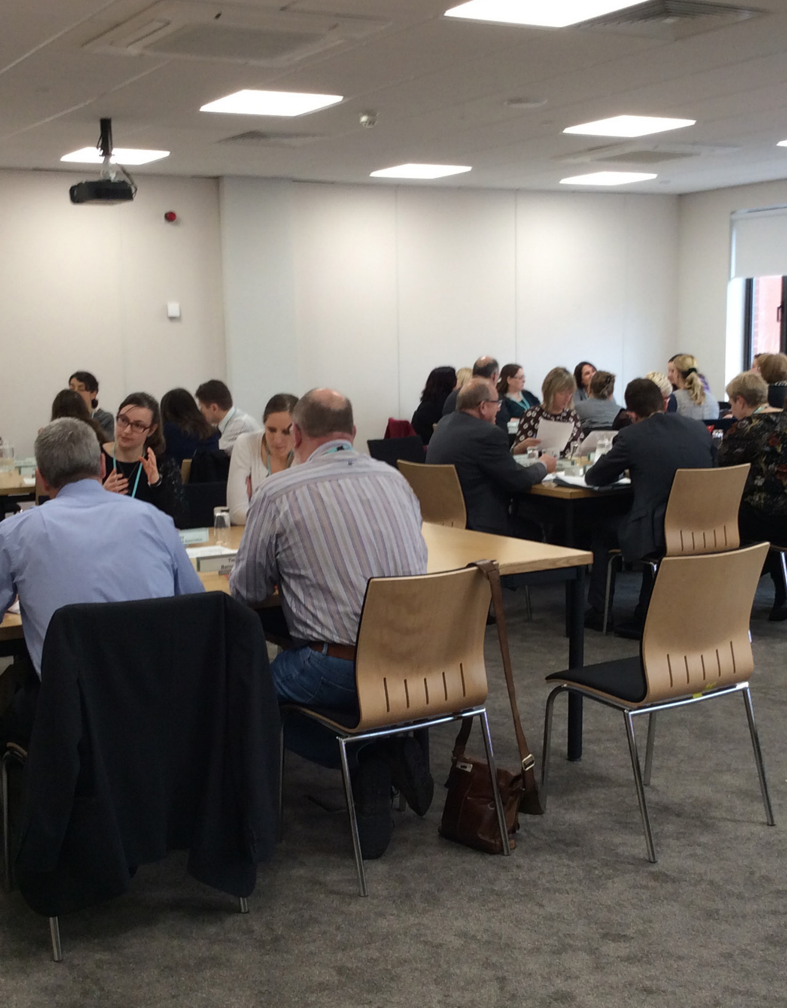
Bil Anghenion Dysgu Ychwanegol a'r Tribiwnlys Addysg (Cymru) drafft Gweithdy bord gron gyda rhanddeiliaid allweddol, Tachwedd 2015